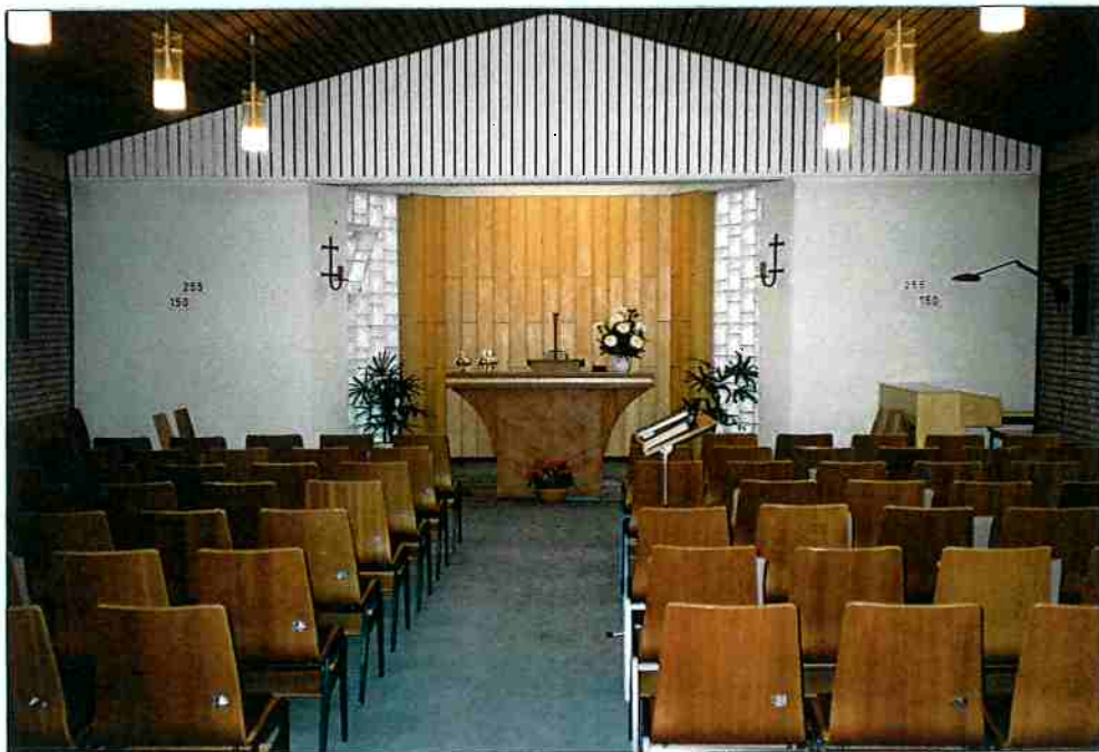
neue und derzeitige Kirche in der Parsevalstraße