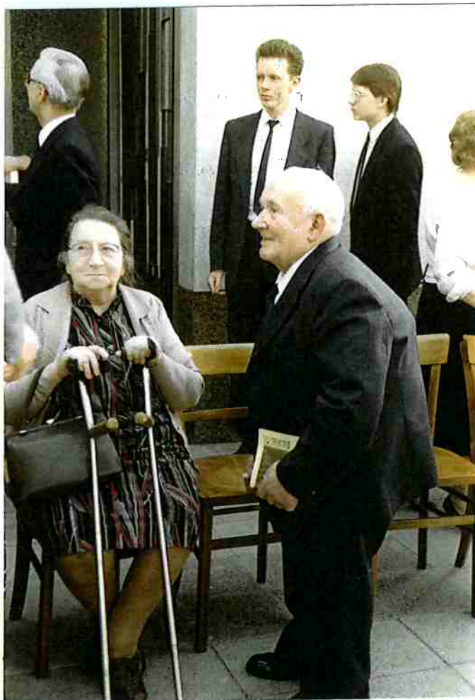
Vorsteher Ev. Knapp verstorben