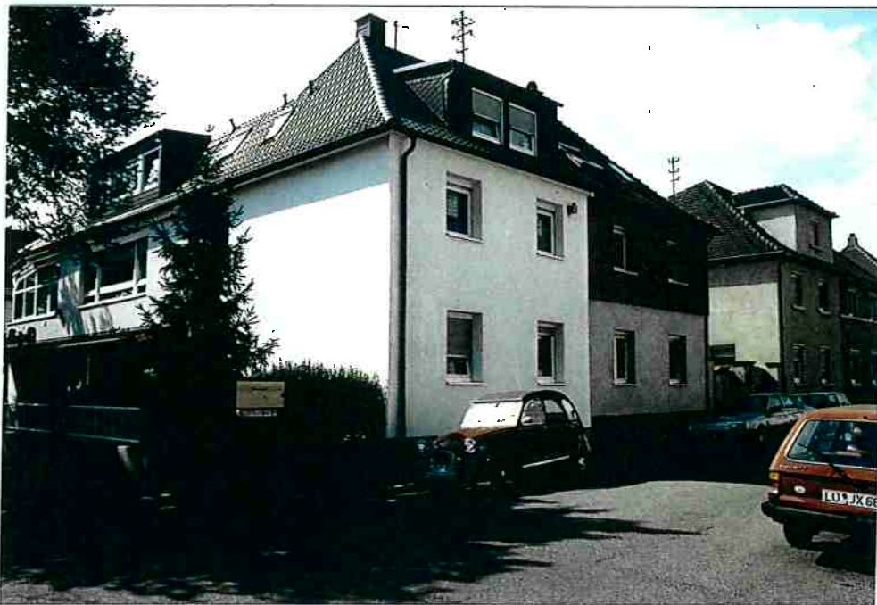
die erste Versammlungsstätte in der Bad-Aussee-Straße